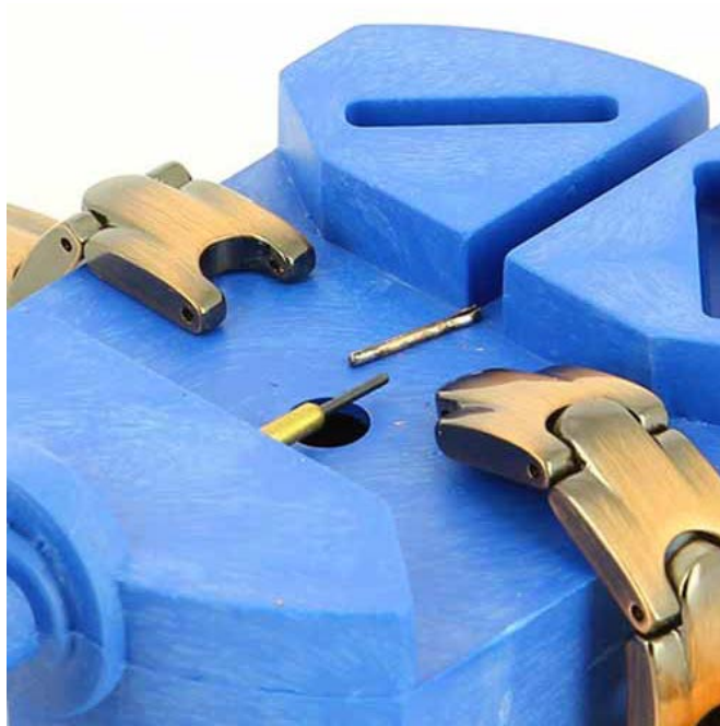
Retrait de maillons

Enlevez ou ajoutez des maillons autant que nécessaire pour raccourcir ou allonger le Bracelet.