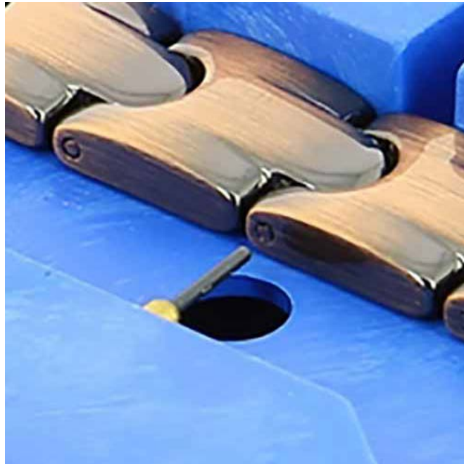
Tige de l'ajusteur devant le bracelet

Assurez-vous que le Bracelet est correctement dans l'outil de telle sorte que l'axe soit poussé dans le fossé sur le côté opposé.