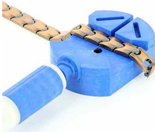
Placement du bracelet sur l'ajusteur

NE PAS APPUYER SUR LE LIEN COTE FENDU. La broche ne pourrait sortir de cette façon et vous pourriez abimer l'instrument !